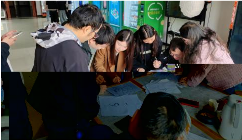
图 卓越团队建设共识营