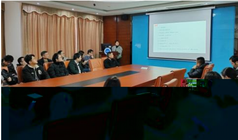
图 员工专业技能培训

2023 年，公司 促 进 发 展 和 才 方 得 成 功。 通 过 创 新 的 和 不 动 公 司 的 持 续 成 长， 工 供 的 发 展 机 会。 通 过 供 多 样 化 的 和 发 展， “ 队 队 共 建 ” 等 活 动 ( 4-5)， 帮 工 技 术 和 管 理； 并 的 和 规 划， 工 的 合 作 和， 包 括 导 发 展 计 划、 技 术 技 术 及 部 等， 地 促 进 工 的 方 发 展。