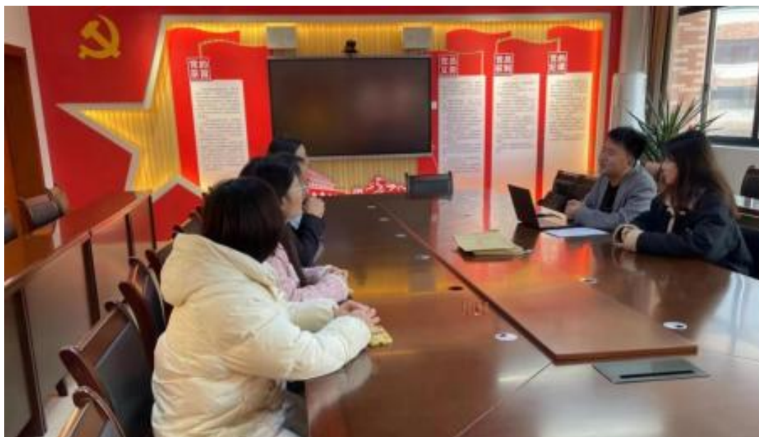
图 校企开展学术研讨项目交流会议

公 高度 队的 ，充分 到 和 的关 ，对 高 和 关 的 。此公 供 ，包 更 、 方法 及 导 发 程，并 持 丰富 的 家 过 、 会和 际案 ， 队 分 的 和 。 常 地 活动， 包 参加 会 、 等 ， 促 间 的 分 ， ， 并 的 队 ( 1)。